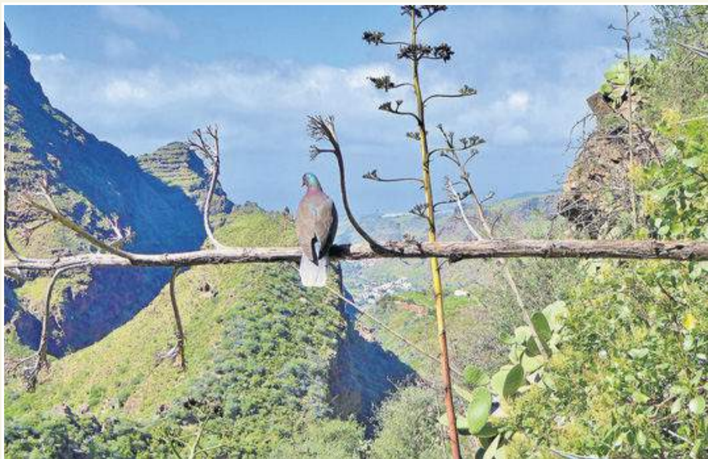
Rabiche. Ejemplar adulto hallado en las inmediaciones del Valle de Agaete.